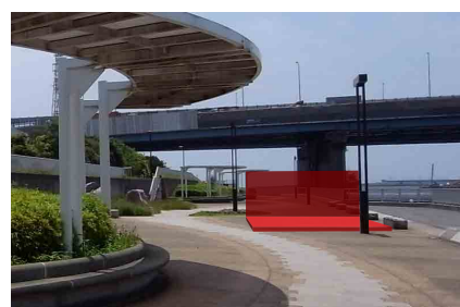
親水公園サウスステージ ステージ上: 7.2×3.6M ステージ下: 7.2×1.8M