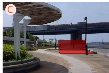
C 親水公園サウスステージ ステージ上：7.2×3.6M ステージ下：7.2×1.8M