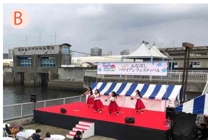
B 親水公園シーサイドステージ ステージ上：9.0×5.4M ステージ下：9.0×1.8M