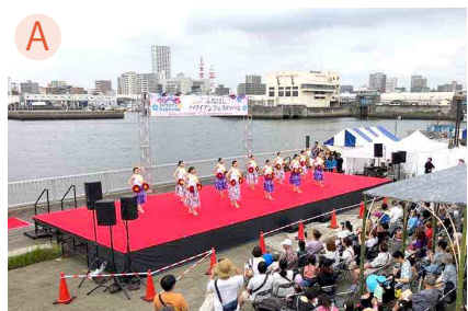
A 親水公園メインステージ ステージ上：14.4×5.4M ステージ下：使用不可